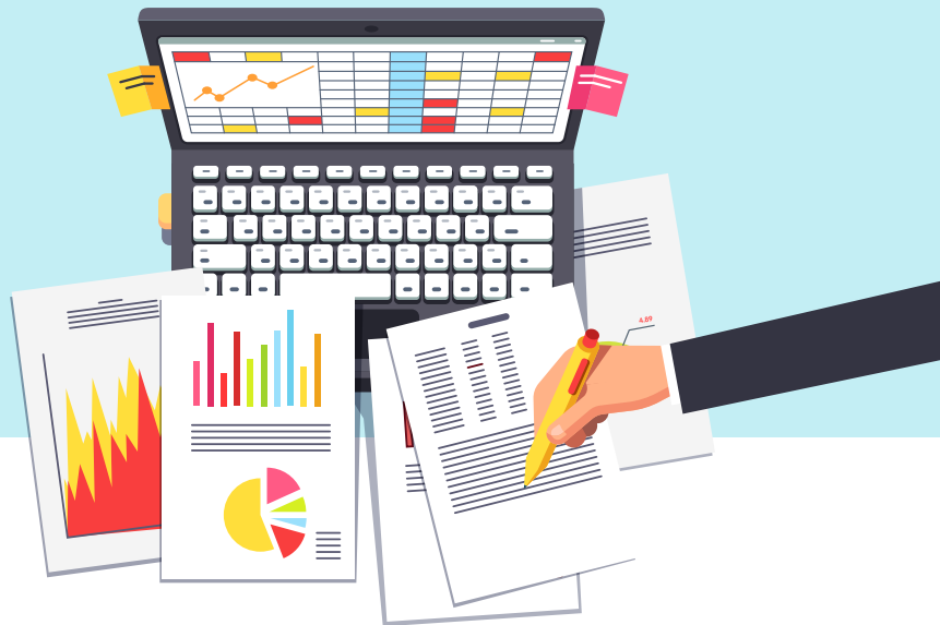
Tabela Price - Parcelas Constantes

Tabela Price - A tabela Price, também conhecida como sistema francês de amortização, é o único modelo de financiamento imobiliário em que as prestações se mantêm sempre no mesmo valor.